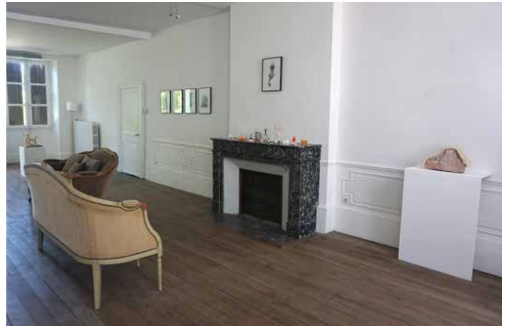
Les sculptures du Sentier 4 , vues dans le contexte de l'exposition personnelle Le Cantique des créatures , DomaineM, Cérilly, juillet 2020