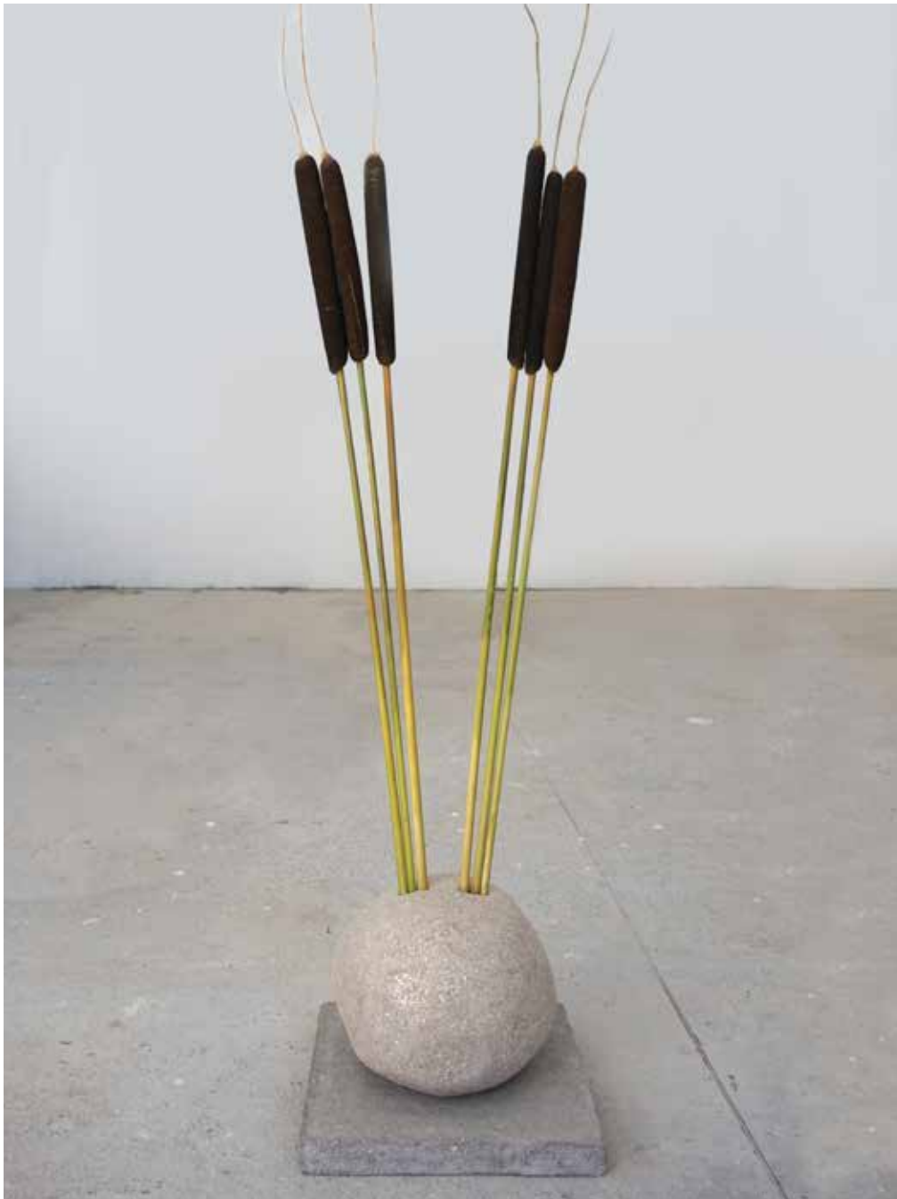
La course du Soleil , polystyrène, ouate de cellulose, colle à papier-peint, 10kg de terre crue, paillettes de mica doré, massettes, 27 x 25,5 cm, h. 105,5 cm