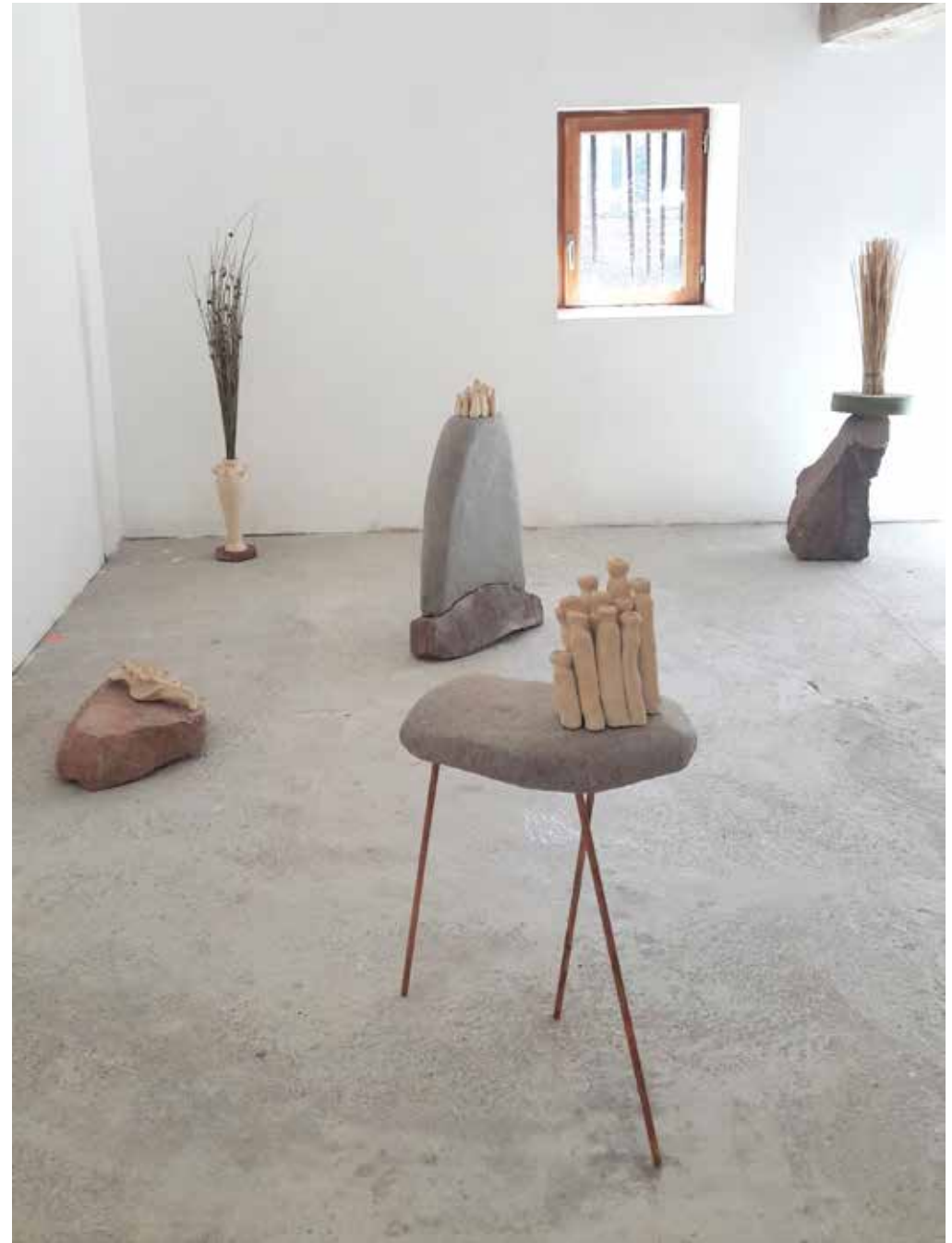
Les sculptures du Sentier 4 , vues d'ensemble lors de l'exposition personnelle Le Cantique des créatures , DomaineM, Cérilly, juillet 2020