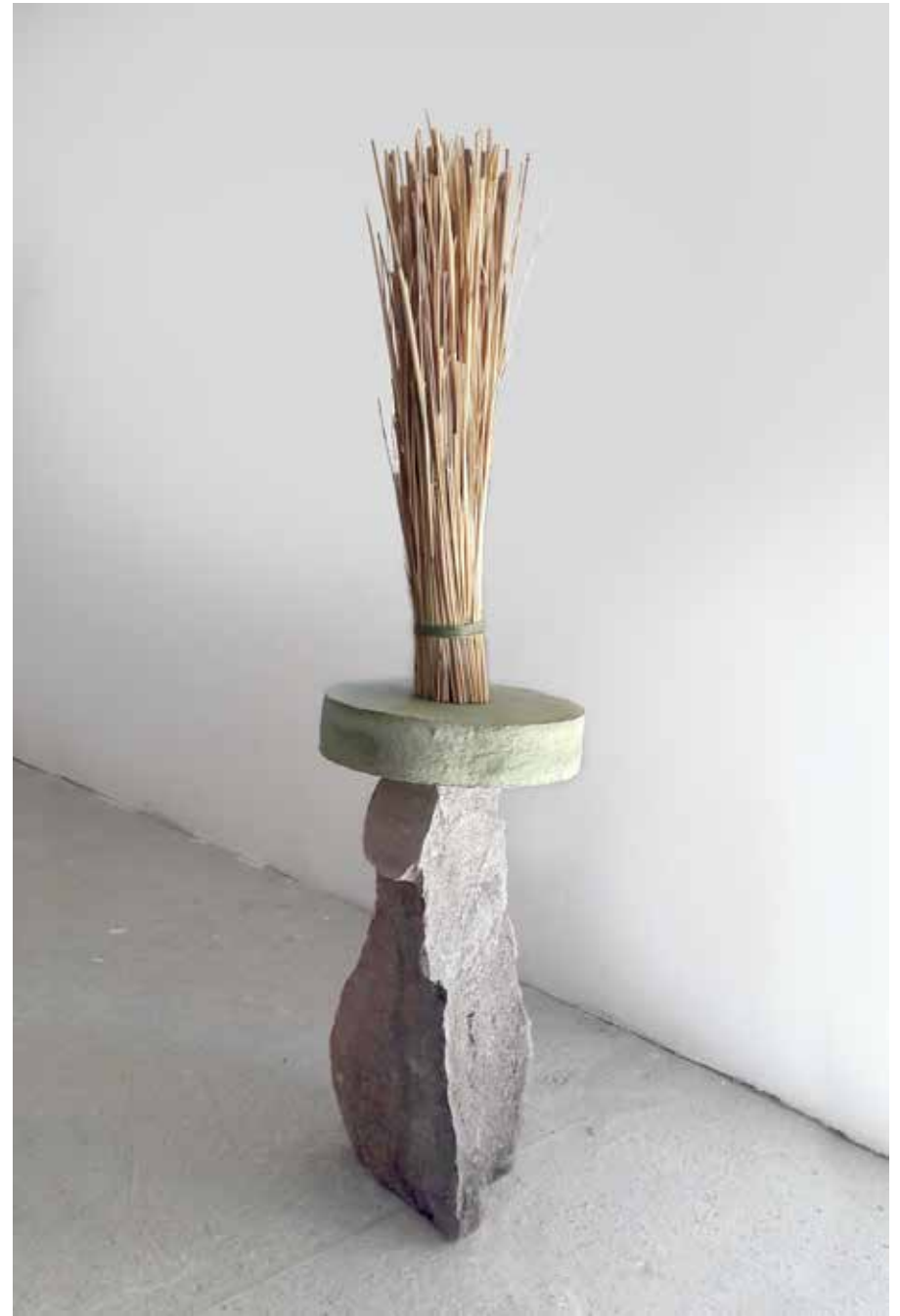
Figure aux blés

Granit rose, polystyrène, ouate de cellulose, pigments, colle à papier-peint, paille de blés, petit-jonc, 42,6 x 35,4 cm, H. 121 cm