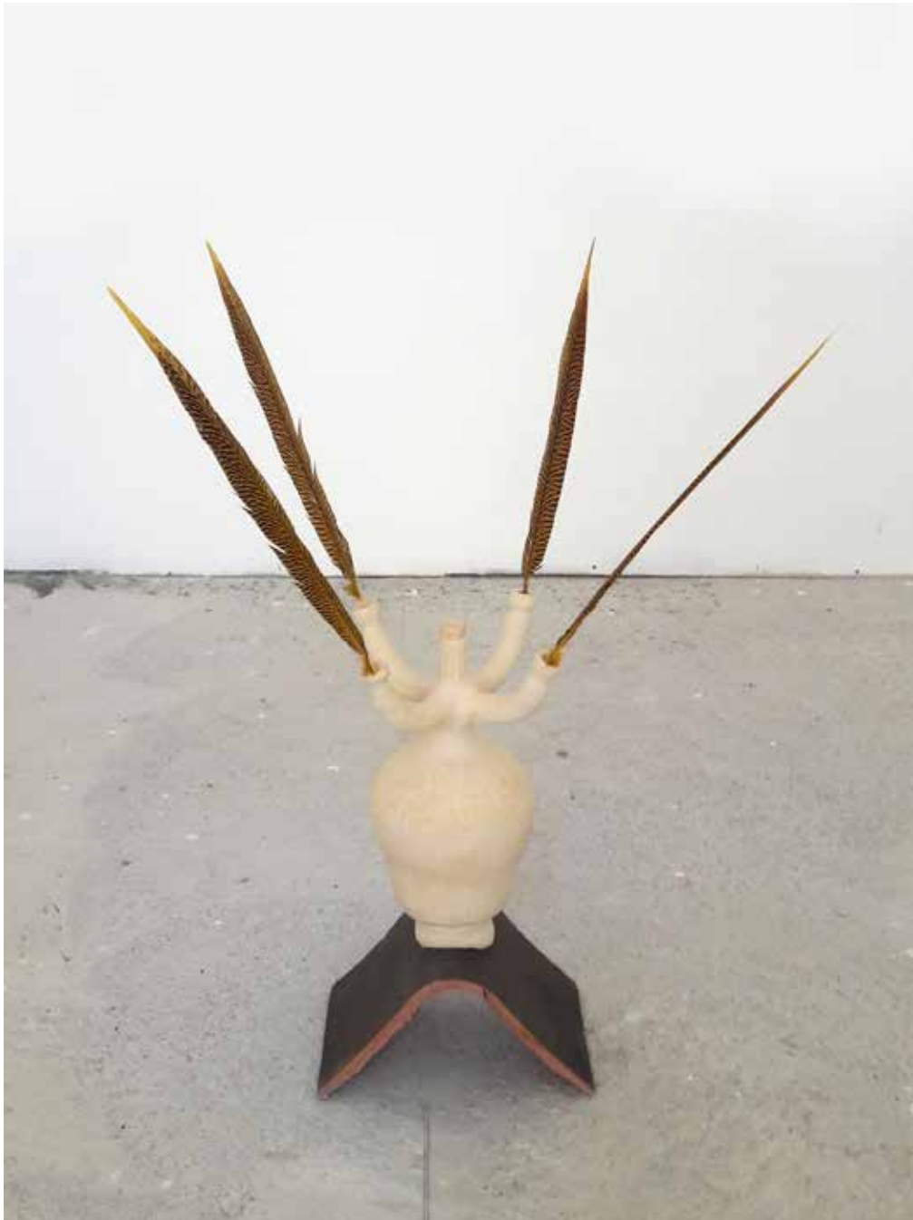
Oracle Tuile de faîtage, grès, plumes de faisan doré teintées, 53 x 45 cm, h. 83 cm