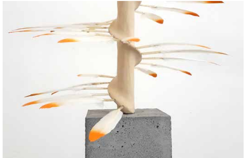
Ope Mortier, résine d'accrochage, cuivre, grès, 184 plumes d'oie teintées, envergure 38 cm, h. 206,5 cm