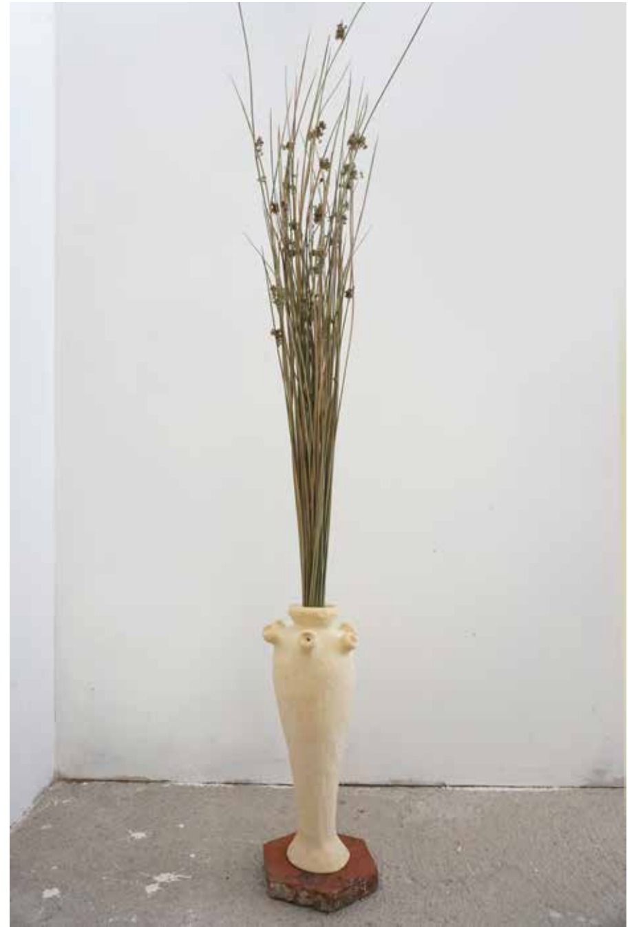
Phénicie Carreau de terre cuite, grès, petits-joncs, 15 x 17 cm, h. 137 cm