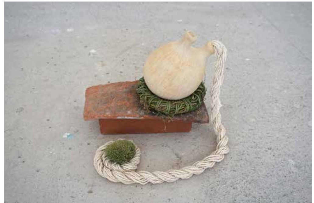
Le Nouveau-Né Tuile, brique, grès, petits-joncs, coton, mousse, 32 x 27 cm, h. 23,5 cm